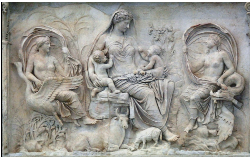
K. Kumaniecki, Historia kultury starożytnej Grecji i Rzymu , Warszawa 1969, s. 452.

Bogini Tellus (Ziemia) – fragment płaskorzeźby na ścianie Ołtarza Pokoju wzniesionego w 9 r. p.n.e. na Campus Martius w Rzymie