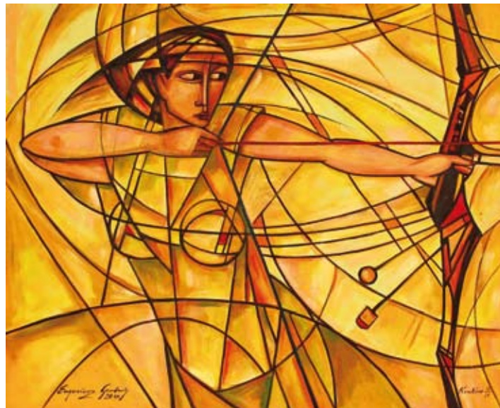
Eugeniusz Gerlach, Łuczniczka złota , 2010, Warszawa, Muzeum Sportu i Turystyki.

Czy sport może być interesującym tematem tekstu kultury? Rozważ problem na podstawie obrazu Eugeniusza Gerlacha i wybranych tekstów kultury