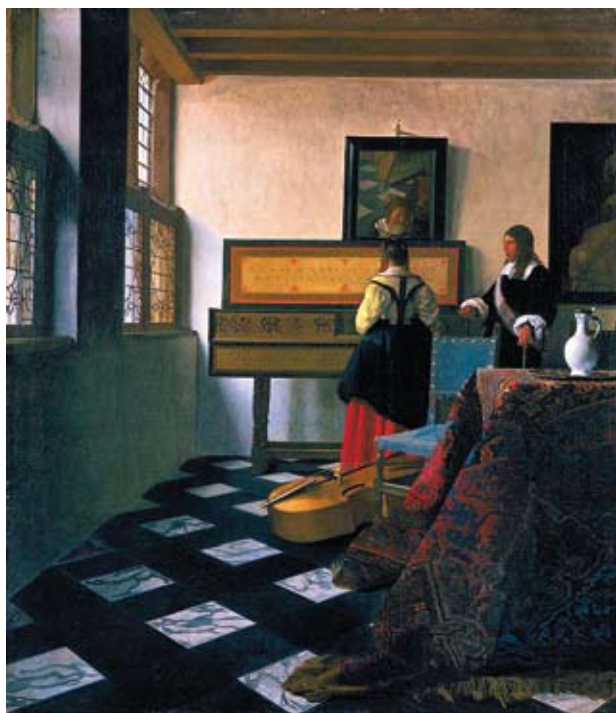
Jan Vermeer, Lekcja muzyki , ok.1659–64, Buckingham Palace.

Jaką rolę w życiu człowieka odgrywa muzyka? Omów zagadnienie, odwołując się do obrazu Jana Vermeera Lekcja muzyki oraz wybranych tekstów kultury.