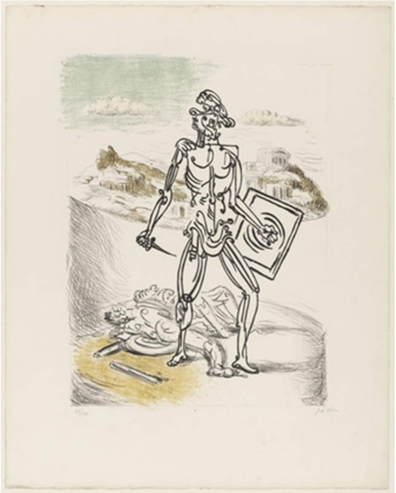
Ilustracja 3. Giorgio de Chirico Gladiator . Załącznik do zadania dla grupy II