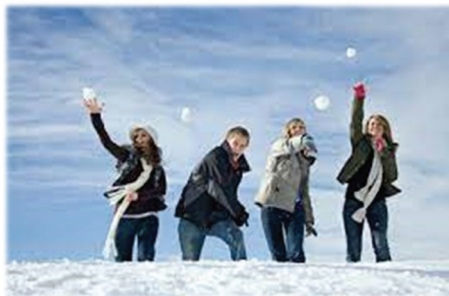
PALLE DI NEVE