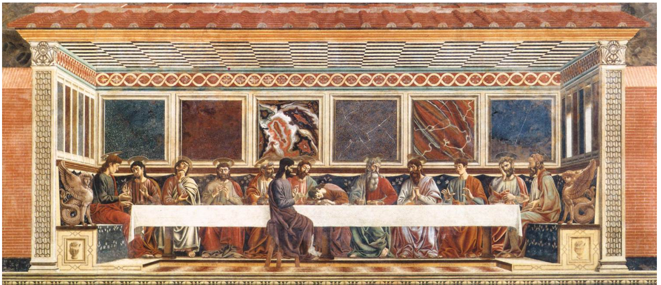
Andrea del Castagno, „Ostatnia wieczerza”, 1445–1450, Sant’Apollonia, Florencja