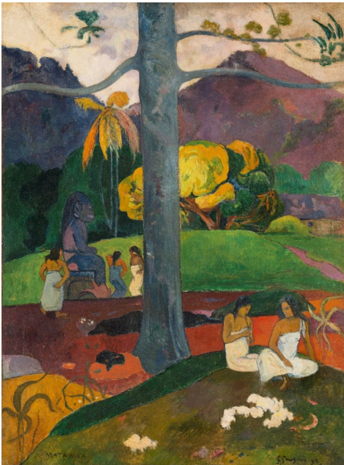
Obraz B Paul Gauguin, „Mata Mua”, 1892