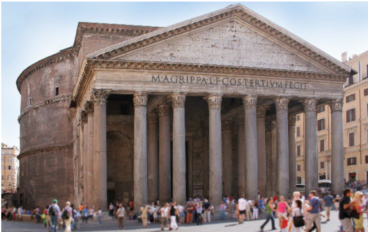
Panteon, Rzym 118–125

Odwołując się do wiedzy własnej oraz do poniższych reprodukcji, podaj jedną cechę Panteonu zaczerpniętą z architektury starożytnej Grecji oraz dwie cechy tej budowli, które są charakterystyczne dla architektury starożytnego Rzymu.