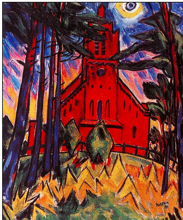
Max Pechstein, Czerwony kościół , 1911, olej na płótnie, kolekcja prywatna