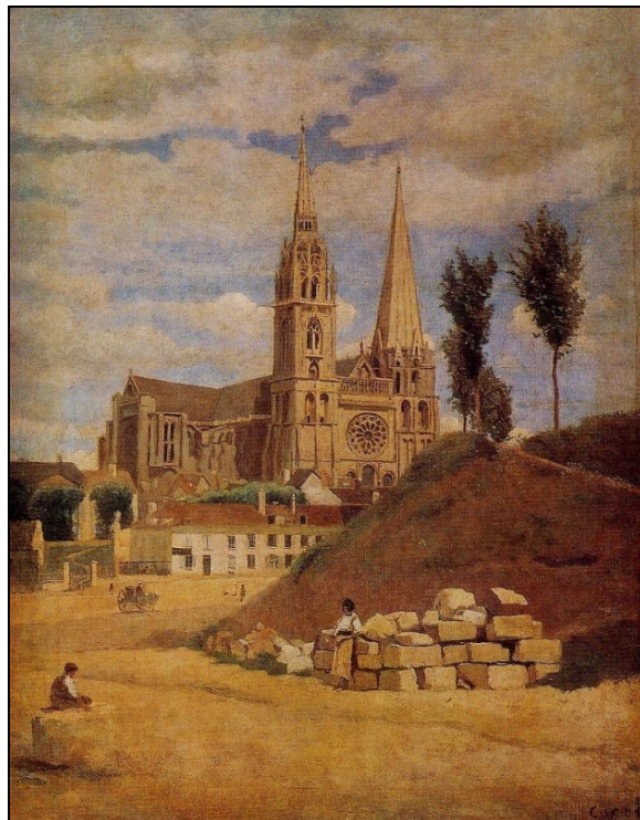
Jean-Baptiste Camille Corot, Katedra w Chartres , 1830, olej na płótnie, Luwr, Paryż